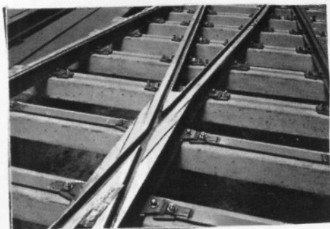
Appareil de voies